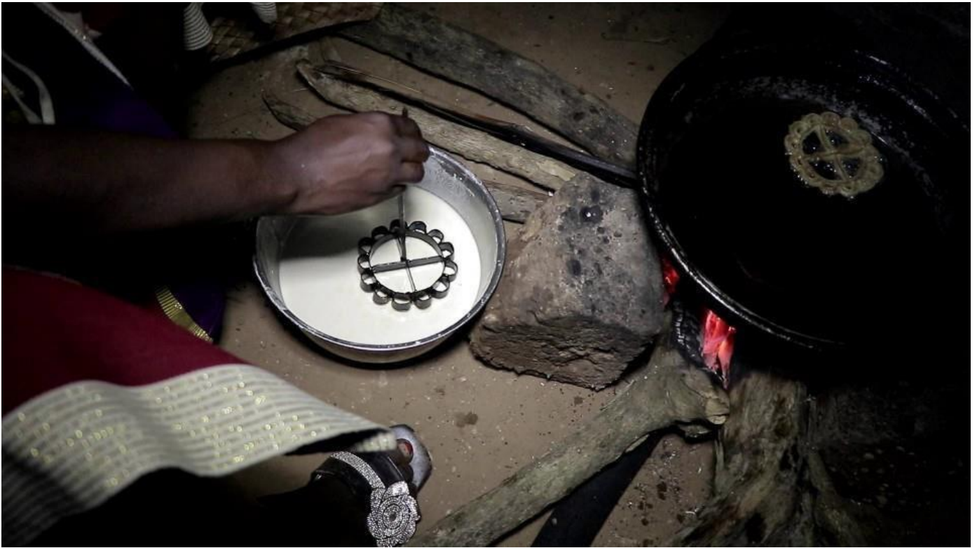
Utilisation du moule à fleurs pour la circonstance.