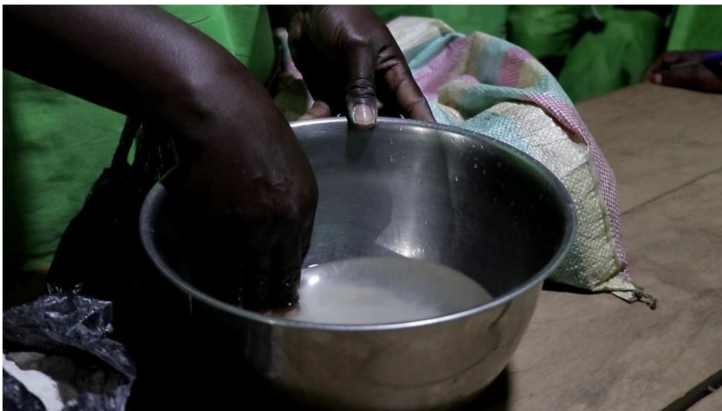
L'eau mélangée au sel de cuisine

Une fois la phase théorique achevée, la phase pratique débute. Dans cette phase, il faut passer au mélange des ingrédients jusqu'à la cuisson.