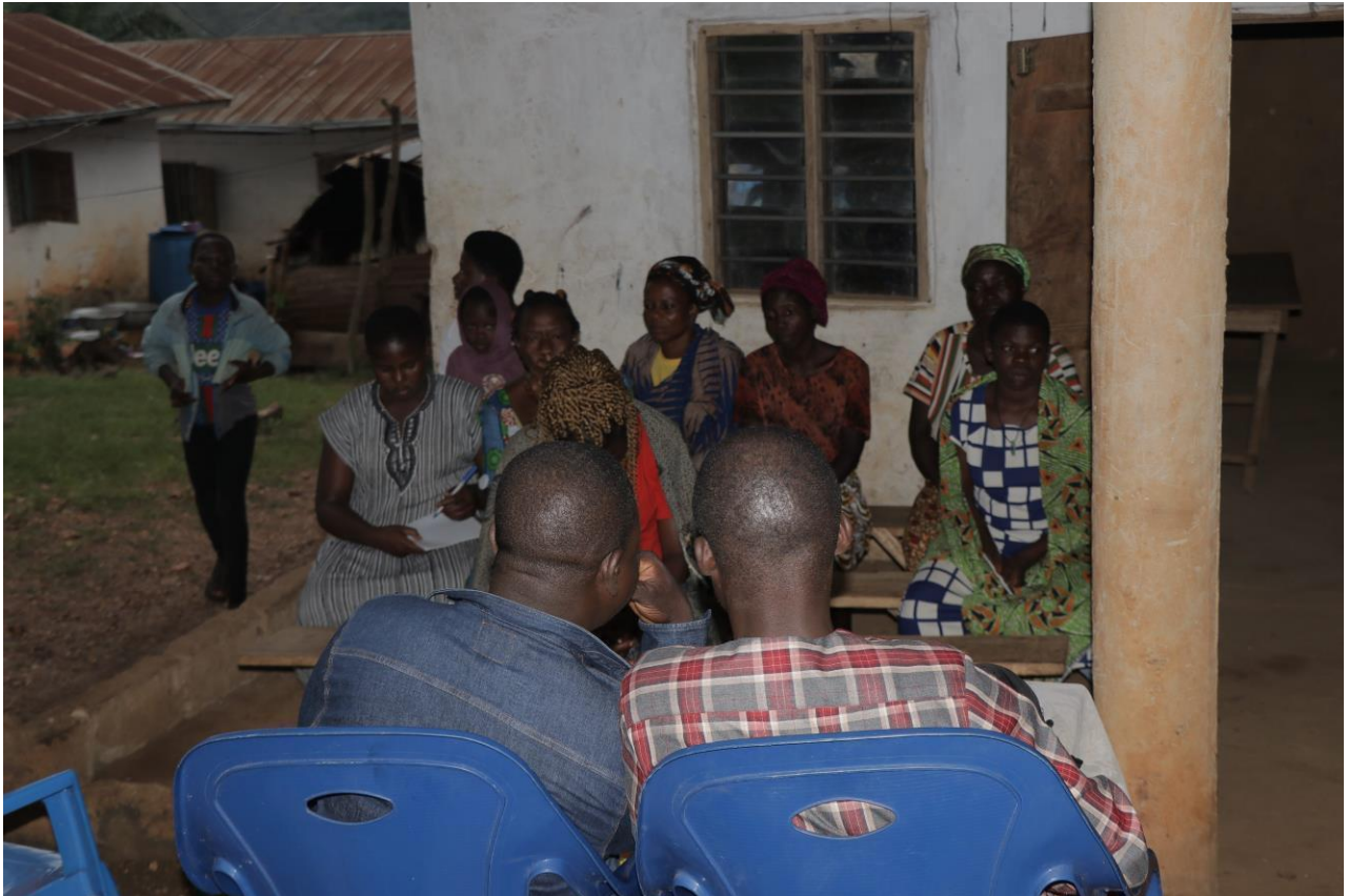
La délégation de l'ONGASEF en entretien avec les participantes à la formation.

Arrivée à 16h45, les activités ont commencé par une prière d'ouverture.