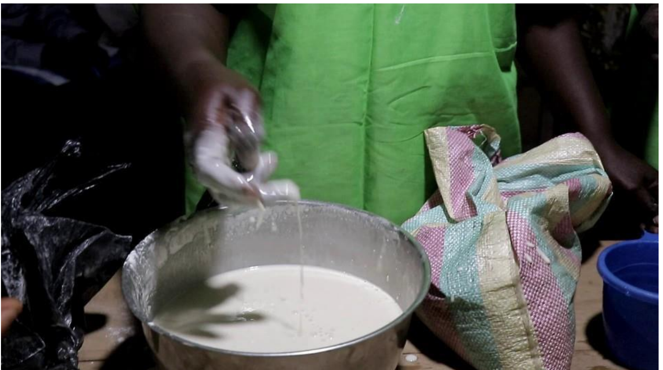
L'aspect de la pâte avant la cuisson