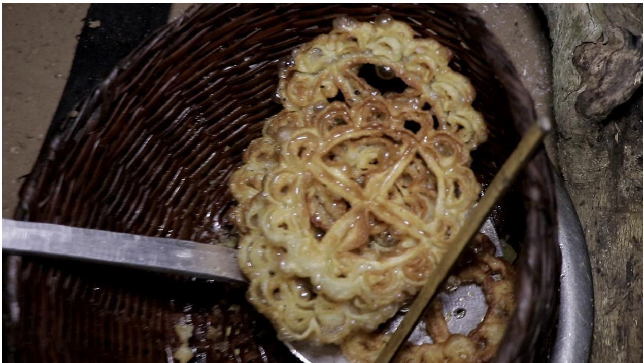
Les gâteaux prêts pour la consommation.