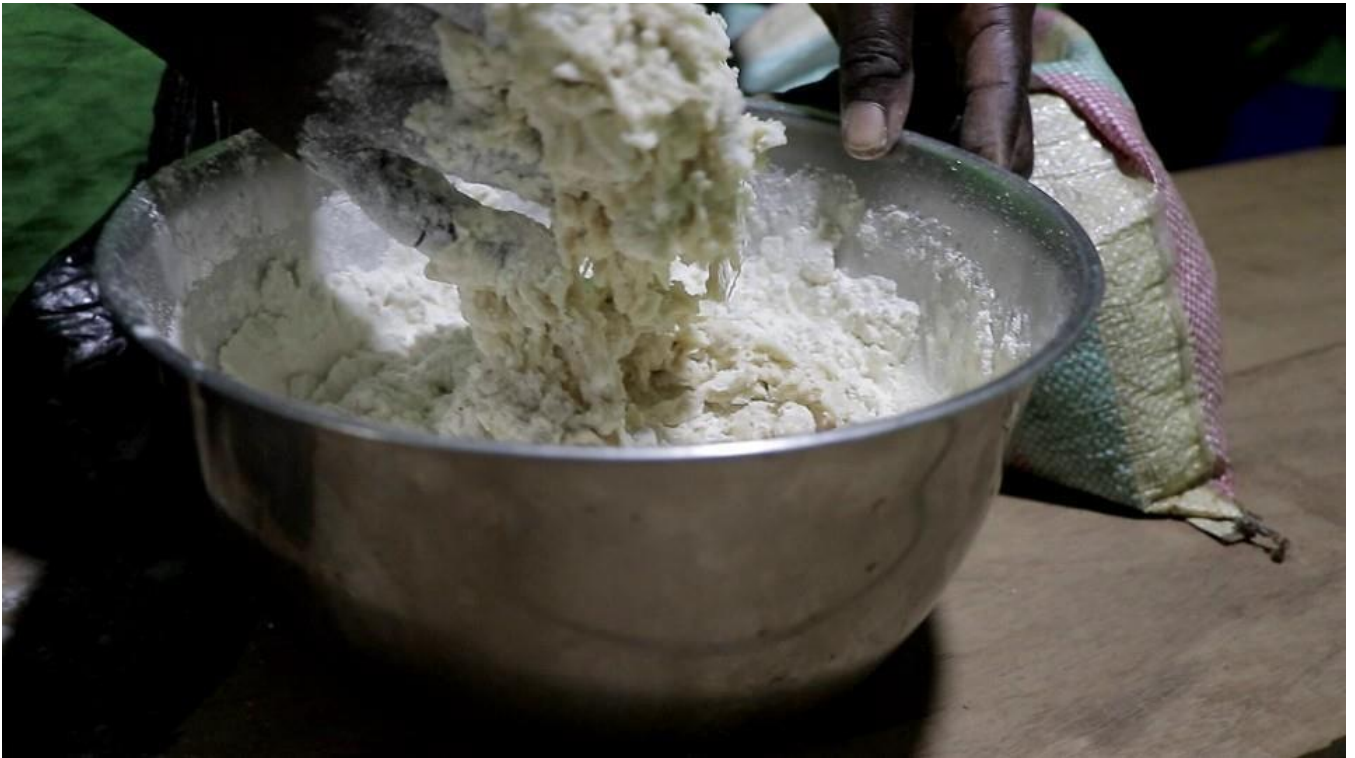
Mélange des ingrédients pour obtenir une pâte homogène