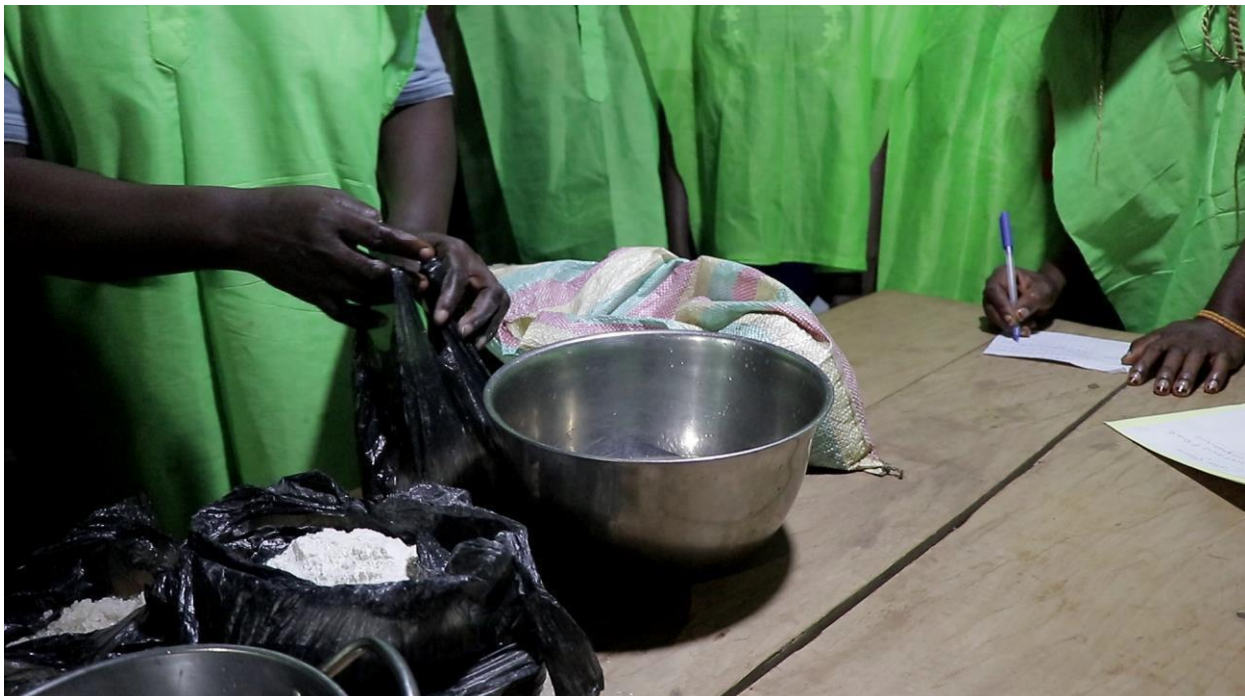
La formatrice avec les ingrédients