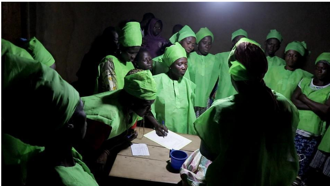
La formatrice en pleine explication et les participantes attentives prenant notes.

Une fois la phase théorique achevée, la phase pratique débute. Dans cette phase, il faut passer au mélange des ingrédients jusqu'à la cuisson.