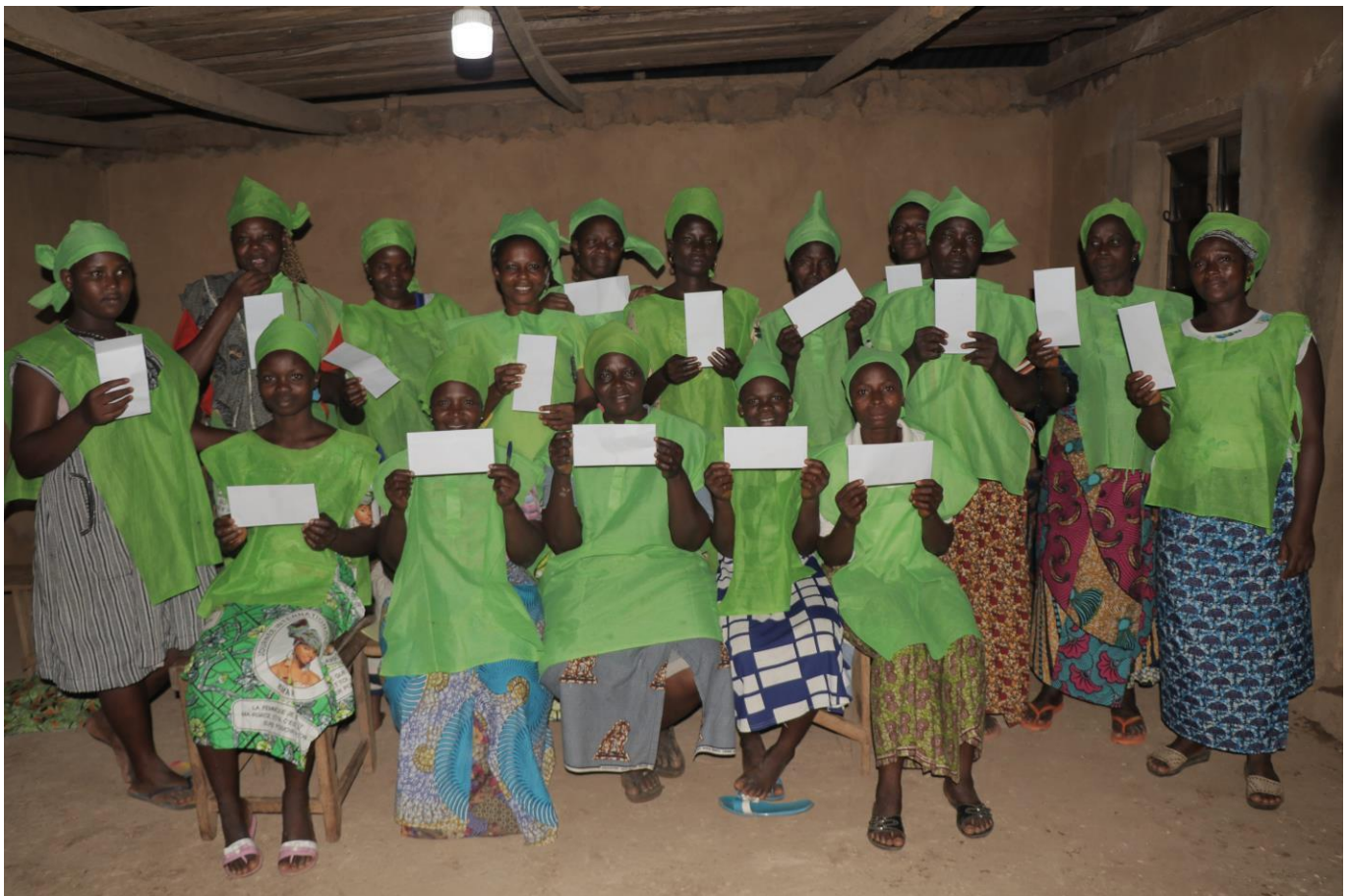
La joie des récipiendaires brandissant leurs enveloppes en signe de reconnaissance.