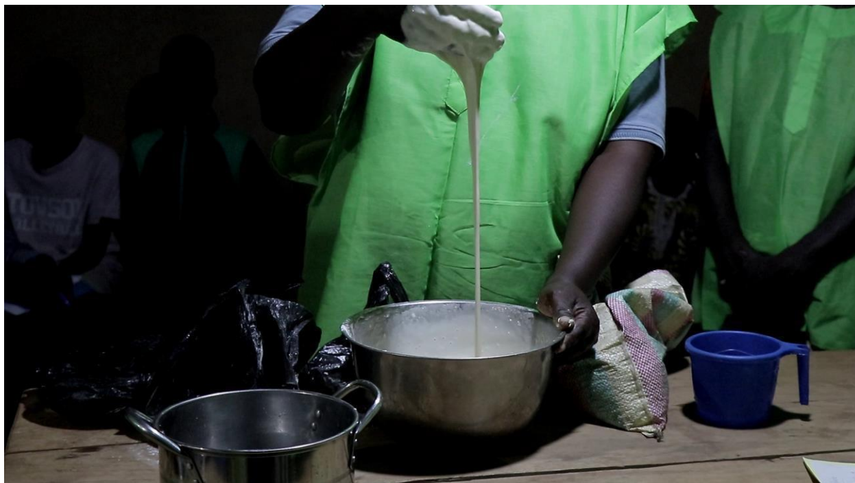
La pâte prête à passer dans l'huile végétale.