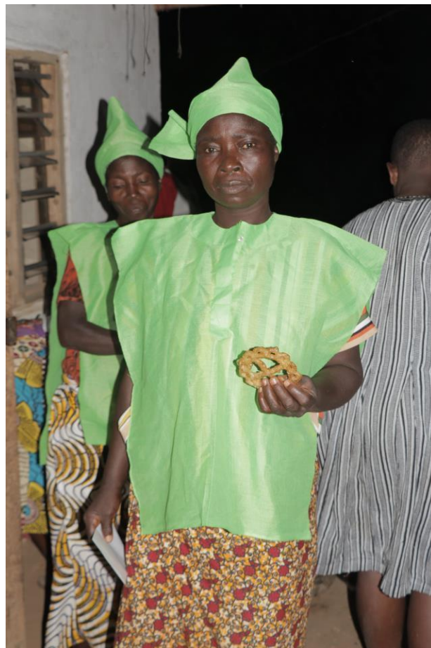
Les résultats de la formation