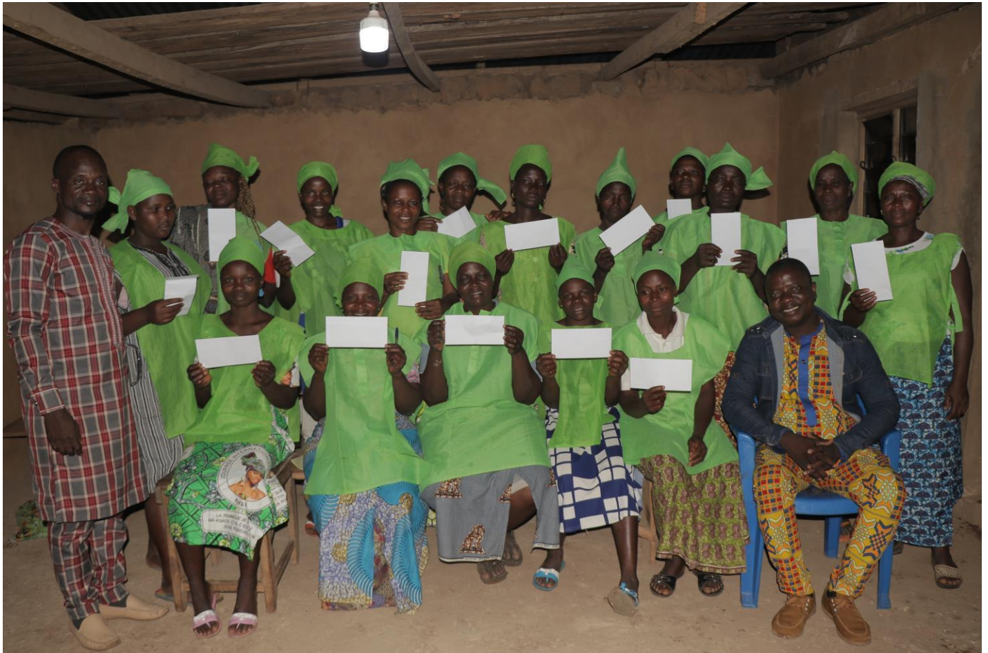
Vue d'ensemble des participantes à la formation avec le Président de l'ONG (à droite) et le Directeur Général de l'ONG (à gauche).

Commencée à Zogbégan le 05 Octobre à 16h45, l'activité a mobilisé 16 participantes.